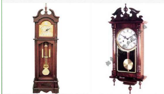
中国人のお祝いに置時計を送ると喜ばれる

正解は○ 梨の中国語発音は「リ」、分離、離開、離れるの離も「リ」の発音、一つの梨を切って、誰と分けて食べるとは「分梨」ということです。