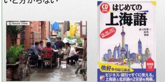
上海方言でしゃべると北京の人は2回聞かないと分からない

また、親友が亡くなったら、相手の家やお葬式にお悔やみに行く事や、最後の終末を見送りとする事は「送終」（送終）と表現されています、発音は全く同じなので、置き時計はプレゼントとしては良くないのです。