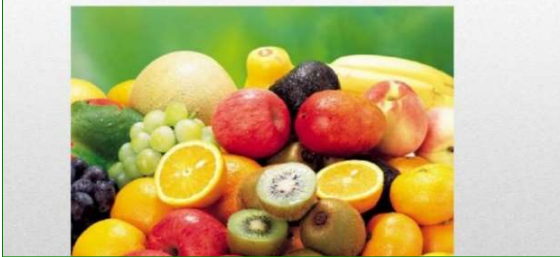
リンゴは2人で半分に分けて食べてもいいですが、梨は半分に分けて食べてはいけない

正解は○ 梨の中国語発音は「リ」、分離、離開、離れるの離も「リ」の発音、一つの梨を切って、誰と分けて食べるとは「分梨」ということです。