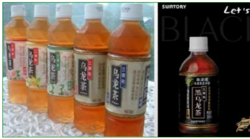
ペットボトルの緑茶に砂糖が入っている