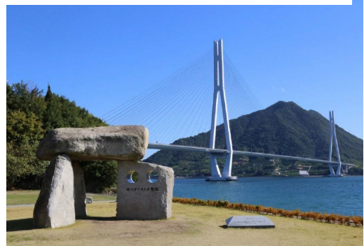
道の駅「多々羅しまなみ公園」で昼食