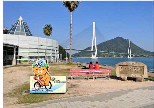
道の駅「多々羅しまなみ公園」で昼食