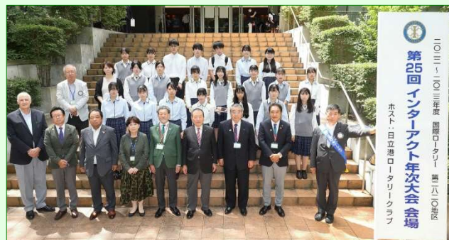
茨城キリスト教学園IAC