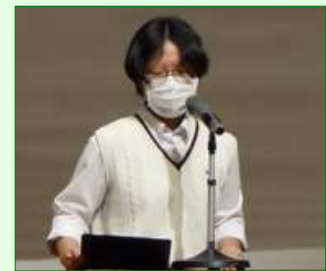
次年度ホスト校挨拶 水城高校IAC 会長