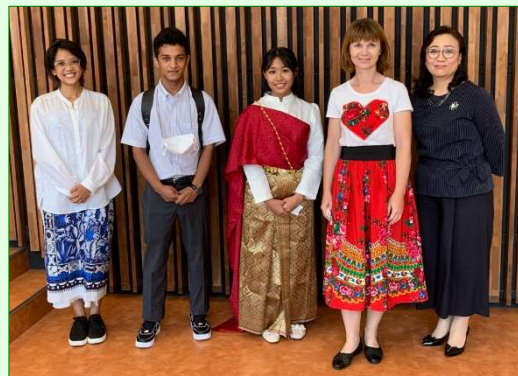
午後の部 異文化プレゼンテーション 講師の方々