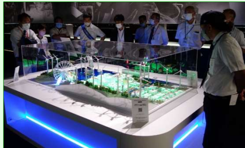
日立オリジンパーク見学