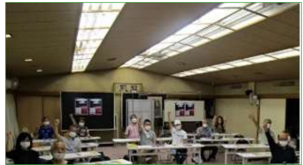
社会 | 速報 | 神奈川 毎日新聞 | 2022/8/8 18:15 (最終更新 8/8 18:15) | 有料記事 856文字