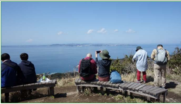
ご清聴ありがとうございました。