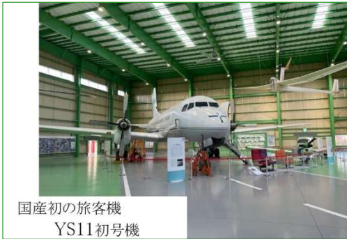
国産初の旅客機 YS11初号機

特徴的なエンジン部分…私たち以上の世代は良く知っていますよね！もともと科学博物館の機体で、それを引き取って、苦勞して羽田から公道を運んできたんだそうです。その様子はニュースにもなっていました。