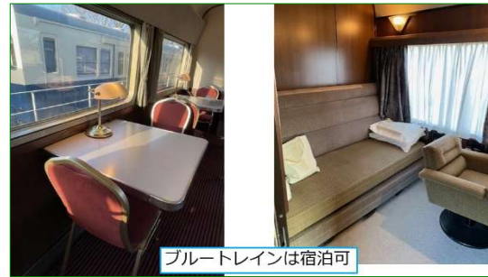
ブルートレインは宿泊可

そして、パーク内では現在地下深くまで温泉が掘削されていました。驚きのスケール感。春に向けて注目されるスポットになること、間違いなさそうです。