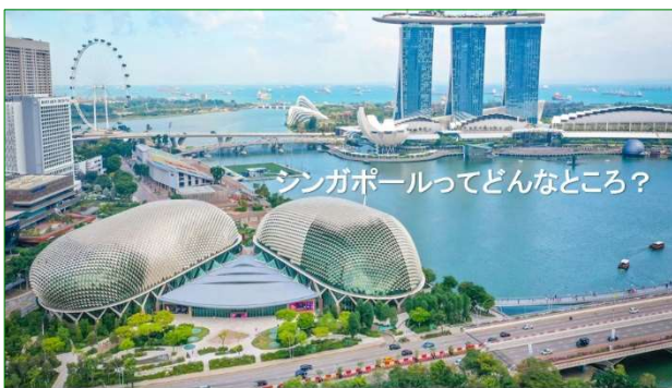
ロータリー国際大会 2024 in シンガポール

本年のロータリー国際大会がシンガポールで開催されるとのことで、せっかく私自身が約4年間シンガポール駐在してきたので、その駐在経験も踏まえて、“シンガポールってどんなところ?”と題して、シンガポールの基本情報を住んでみて感じたことを含めお話をしたいと思います。