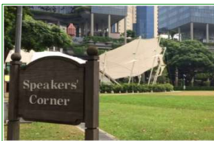
※「スピーカース・コーナー (Speakers' Corner)」市街地にある公園の一角にある。国民がパブリスピーチやデモを行える場所として、2000年に設置。近年では、LGBTの権利を主張するデモが毎年行われたりする。ただ、政府に事前登録し許可を得ることが必要でプラカードに書ける言葉などにも制約があり、使われることはあまり多くない。民主主義国家とはいえ、メディアなどが言動統制されているシンガポールの現状を象徴するような場所。

“シンガポールを訪れる人、シンガポールに住む人に不快感をさせない”を政府主導で強力に推進。これの1つのアクションが、数々の罰金制度だったりする。その他として・・・