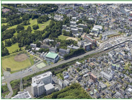
生誕の地 福島県桑折（こおり）町