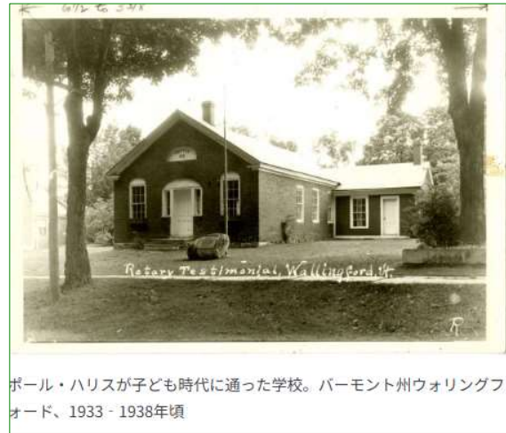
ポール・ハリスが子ども時代に通った学校。バーモント州ウォリングフォード、1933 - 1938年頃